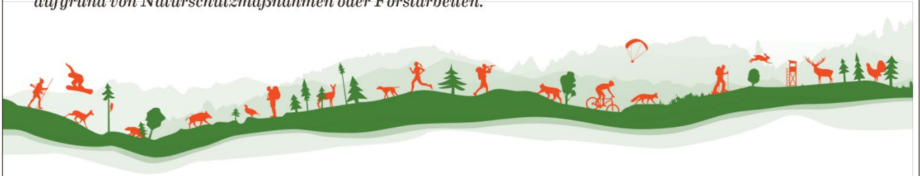
Abbildung 1: bewusstWilde Verhaltenshinweise

Auf deiner Tour können besonders geschützte Gebiete für Wildtiere liegen (bspw. Wildruhe- oder Naturschutzgebiete...). Informiere dich über deren Regeln und toleriere kurzzeitige Sperrungen von Wegen aufgrund von Naturschutzmaßnahmen oder Forstarbeiten.